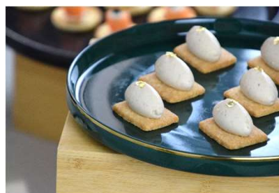
Palet Breton, crémeux vanille, coulis de fruits exotique