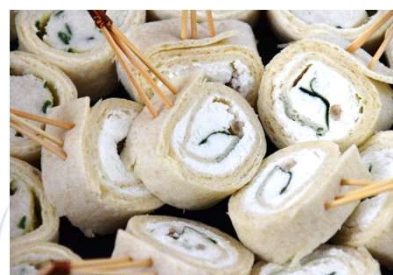
Wrap au chèvre et pousse d'épinards