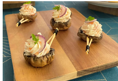
Bouton au saumon fumé