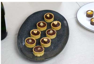
Tartelette chocolat praliné