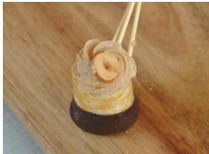
Crêpe roulée à la noisette