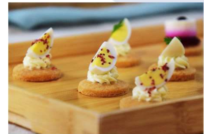
Œufs mimosa à la truffe