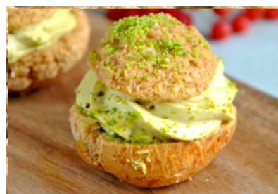
Chou praliné pistache