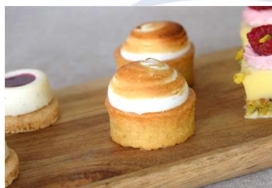
Tartelette à la bergamotte meringüée