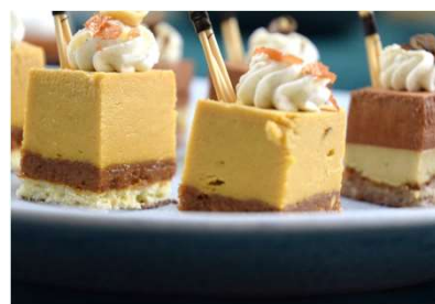
Carroussel en mignardise