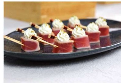
Thon rouge, crème à la racine du Japon