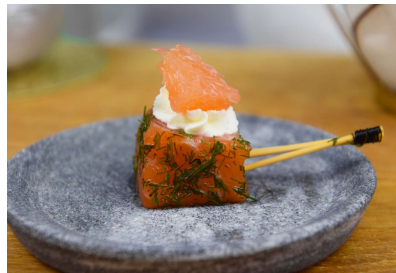
Saumon gravlax, voile à l'aneth