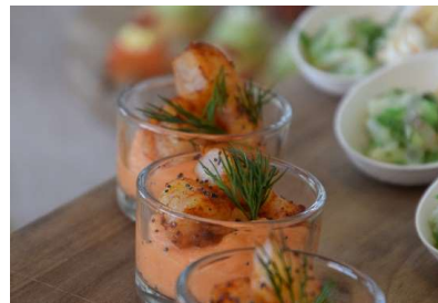
Gambas au curry rouge et douceur de patate douce