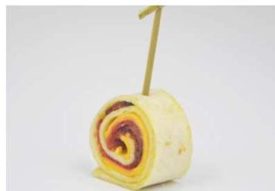
Wrap de bœuf au cheddar, moutarde douce