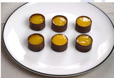
Quenelle à l'orange amère