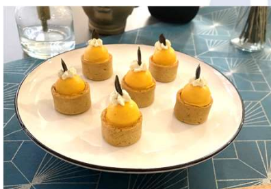
Dôme de butternut