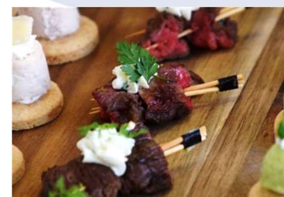
Bœuf mariné teriyaki, sauce tartare