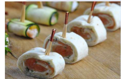
Wrap de saumon, concombre, fromage frais