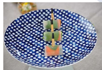
Maki fraîcheur végétale