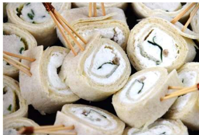
Wrap au chèvre et pousse d'épinards