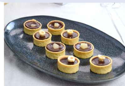
Tartelette poire chocolat