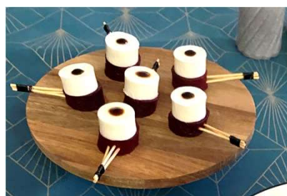
Stracciatella X betterave violette