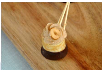
Crêpe roulée à la noisette