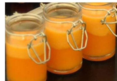
Crème de courge à la noisette