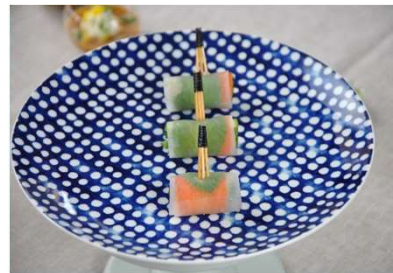
Maki fraîcheur végétale