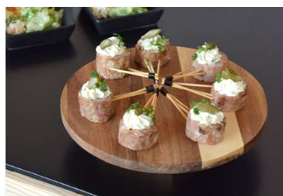
Canon de veau confit, sauce tartare