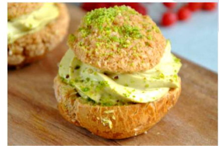
Chou praliné pistache