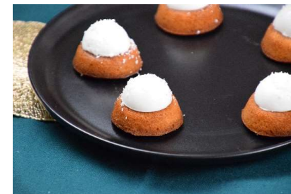
Perle de neige