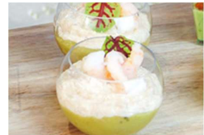
Guacamole aux crevettes et thon, sauce cocktail