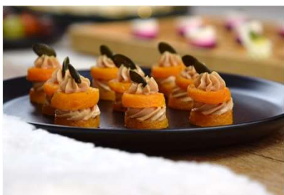
Douceur de foie gras sur disque de potimarron