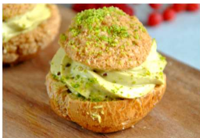
Chou praliné noisette à l'ancienne / Chou praliné pistache