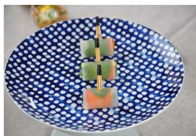
Maki fraîcheur végétale