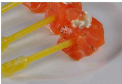
Saumon gravlax, voile à l'aneth