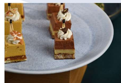
Mocaccino en mignardise