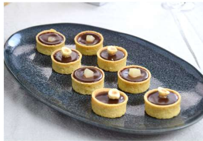
Tartelette cocktail chocolat-praliné