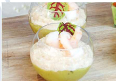
Guacamole aux crevettes et thon, sauce cocktail