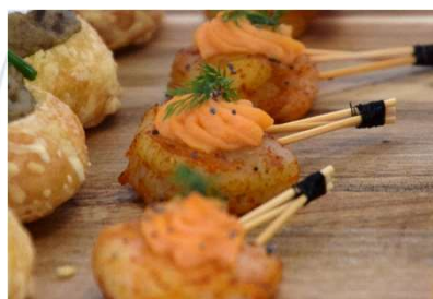
Gambas piquée, douceur de patate douce