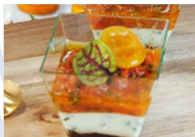
Fondant de chèvre, condiment de tomate