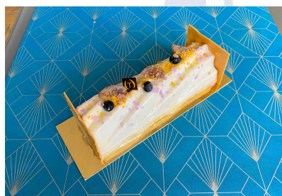
Chou praliné noisette