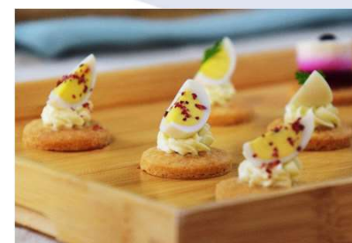
Œuf mimosa à la truffe