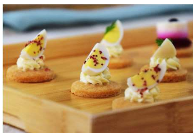
Œufs mimosa à la truffe