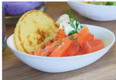
Tartare de saumon au wakamé, blinis et sa cuillère